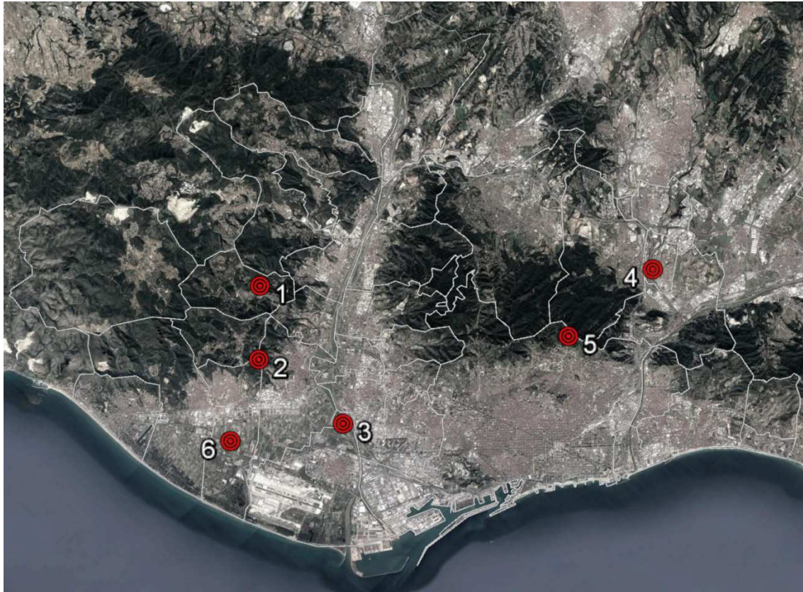
Gràfic 2: Mapa de conflictes al voltant de l'agricultura metropolitana (no exhaustiu).

Tenint en compte tot el que s'ha exposat, s'identifiquen tota una sèrie de conflictes al voltant d'aquestes temàtiques presents a l'àrea metropolitana (gràfic 2)